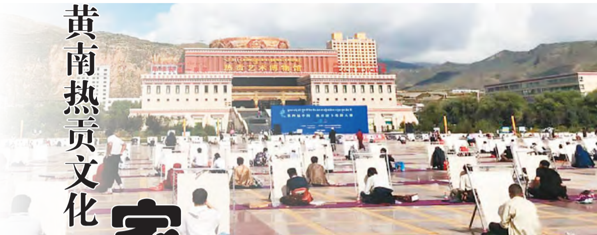
2018年8月8日,第四届中国·热贡唐卡绘制大赛在热贡广场拉开帷幕。