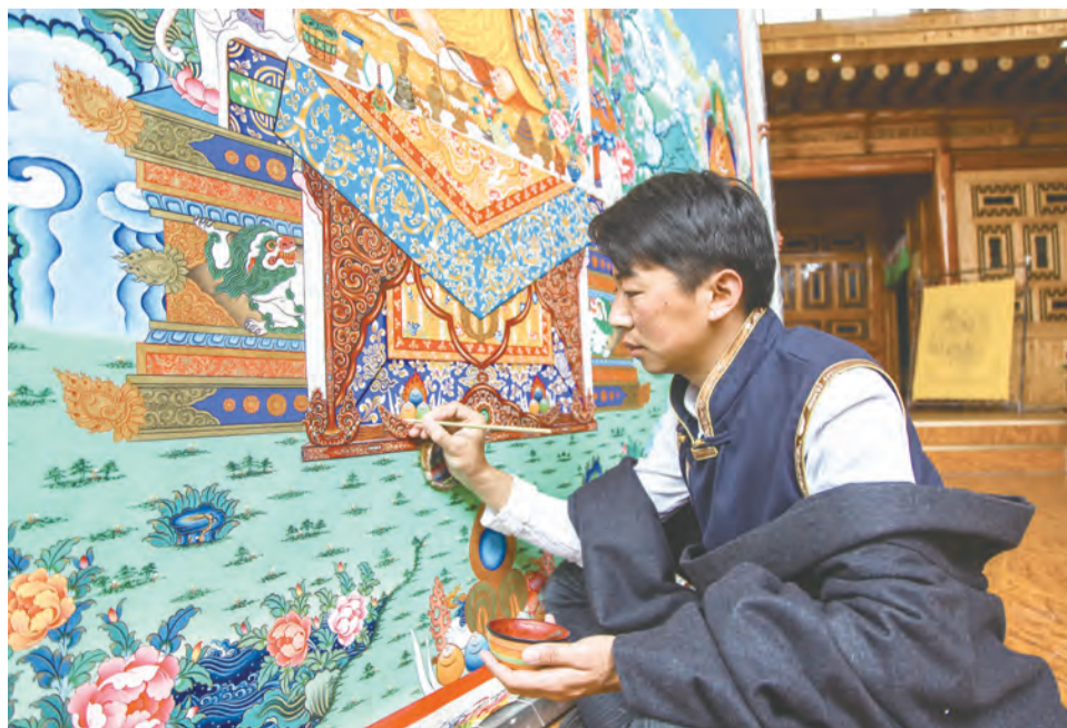
画师正在绘制唐卡